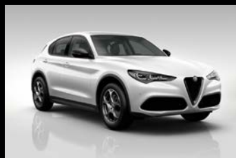
Bílá Alfa (2H6-240)