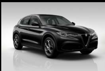
Černá Vulcano (58B-408)