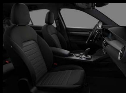
Komfortní sedadla v černé látce (Sprint 030)