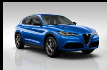
Modrá Misano (5DS-756)