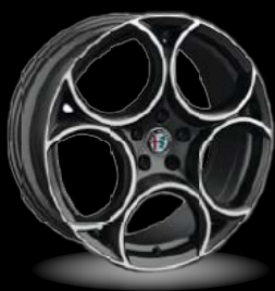
19" disky z lehkých slitin Sport (Sprint 3DY)