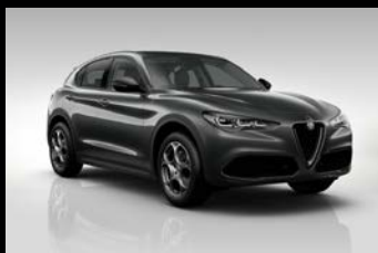
Šedá Vesuvio (5CE-035)