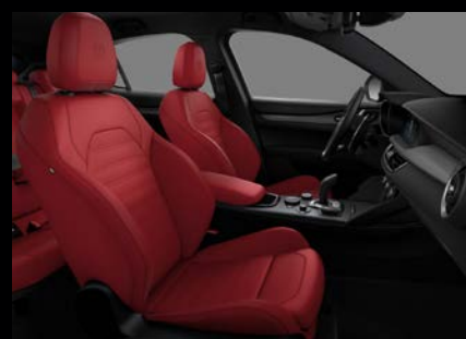
Sportovní perforovaná sedadla v červené kůži (Sprint a Veloce 557)

*s paketem Performance kód 897 včetně červeného prošívání