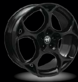
21" disky z lehkých slitin Modale (Sprint a Veloce 3ET)