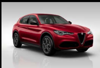
Červená Alfa (5CA-414)