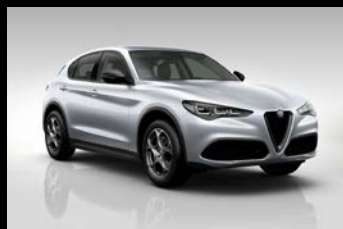
Šedá Moonlight Pearl (61Q-252) Zelená Montreal (6FW-398) Pouze Veloce