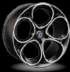
20" disky z lehkých slitin Speciale (Sprint a Veloce WRD)