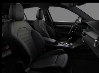
Sportovní perforovaná sedadla v černé kůži (Sprint a Veloce 423)*

*s paketem Performance kód 897 včetně červeného prošívání