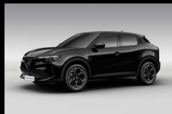
Černá Tortona (5DL-601)