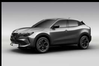
Šedá Arese (5CE-519)*