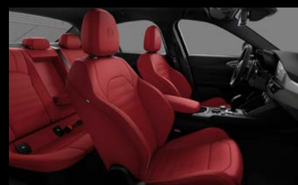
Sportovní perforovaná sedadla v červené kůži (Sprint a Veloce 557)

*s paketem Performance kód 897 včetně červeného prošívání