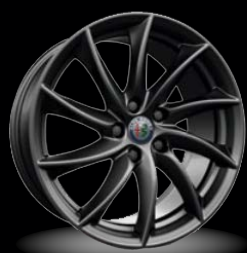
18" disky z lehkých slitin Turbine (Sprint 3C0)