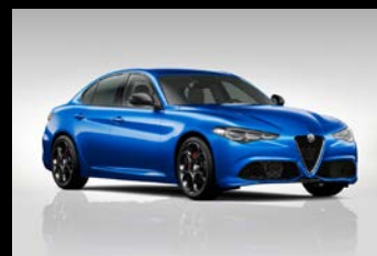
Modrá Misano (5DS-756)