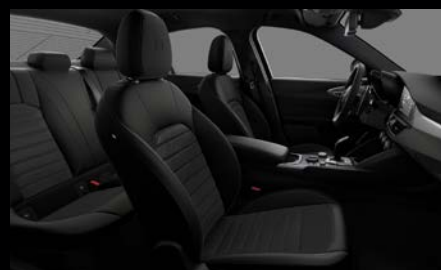
Komfortní sedadla v černé látce (Sprint 030)