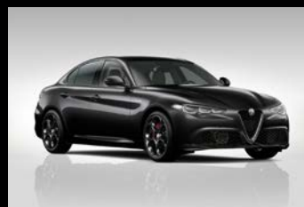
Černá Vulcano (58B-408)