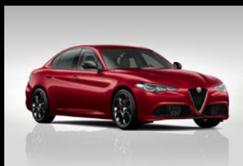
Červená Alfa (5CA-414)