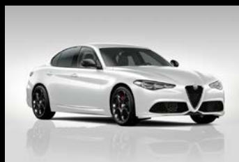
Bílá Alfa (2H6-240)