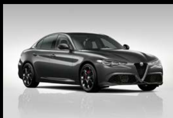
Šedá Vesuvio (5CE-035)