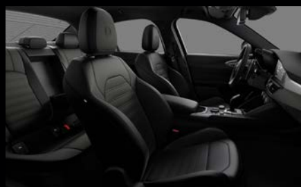
Sportovní perforovaná sedadla v černé kůži (Sprint a Veloce 473)*

*s paketem Performance kód 897 včetně červeného prošívání