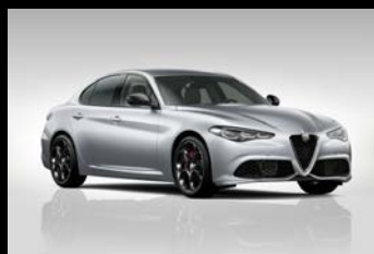
Šedá Moonlight Pearl (61Q-252) Zelená Montreal (6FW-398) Pouze Veloce