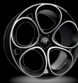
19" disky z lehkých slitin Lusso (Sprint a Veloce 3CX)