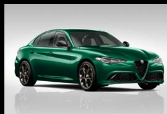
Zelená Montreal (6FW-398) Pouze Veloce