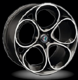
20" disky z lehkých slitin Speciale (Sprint a Veloce WRD)