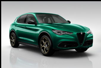
Zelená Montreal (6FW-398) Pouze Veloce