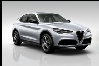
Šedá Moonlight Pearl (61Q-252) Pouze Veloce