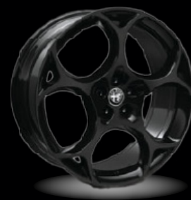
21" disky z lehkých slitin Modale (Sprint a Veloce 3ET)