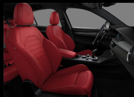
Sportovní perforovaná sedadla v červené kůži (Sprint a Veloce 557)