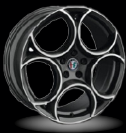
19" disky z lehkých slitin Sport (Sprint 3DY)