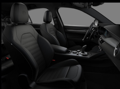
Sportovní perforovaná sedadla v černé kůži (Sprint a Veloce 423)