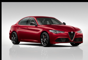
Červená Alfa (5CA-414)