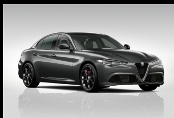
Šedá Vesuvio (5CE-035)