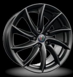
18" disky z lehkých slitin Turbine (Sprint 3C0)