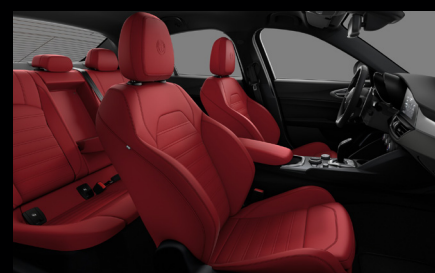
Sportovní perforovaná sedadla v červené kůži (Sprint a Veloce 557)