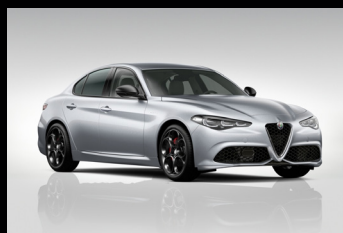
Šedá Moonlight Pearl (61Q-252) Zelená Montreal (6FW-398) Pouze Veloce