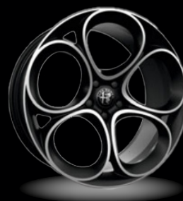
19" disky z lehkých slitin Lusso (Sprint a Veloce 3CX)