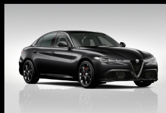
Černá Vulcano (58B-408)