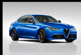
Modrá Misano (5DS-756)