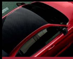
Karbonová střeška bez lakování (4GS)