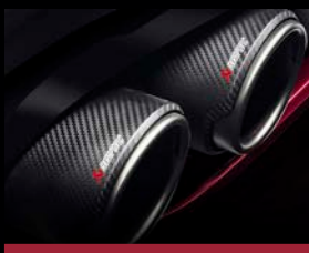
Titanový výfukový systém Akrapovič (NEC)