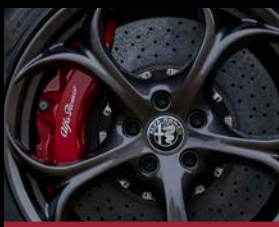
Karbon-keramické brzdy (BRM) *červené lakování třmenů lze objednat i na standardní brzdový systém