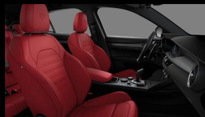
Sportovní perforovaná sedadla v červené kůži (Sprint a Veloce 557)