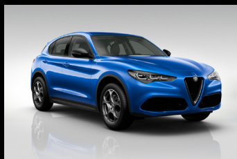
Modrá Misano (5DS-756)