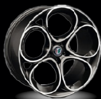
20" disky z lehkých slitin Speciale (Sprint a Veloce WRD)