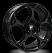
21" disky z lehkých slitin Modale (Sprint a Veloce 3ET)