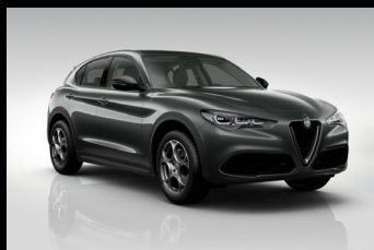
Šedá Vesuvio (5CE-035)