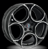
19" disky z lehkých slitin Sport (Sprint 3DY)