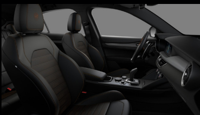
Sportovní perforovaná sedadla v černé kůži s hnědým prošíváním a podkresem (Intensa 071)