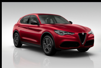
Červená Alfa (5CA-414)