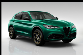
Zelená Montreal (6FW-398) Pouze Intensa