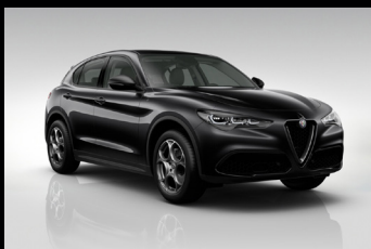
Černá Vulcano (58B-408)