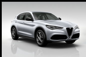
Šedá Moonlight Pearl (61Q-252)