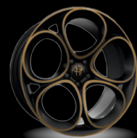
20" disky z lehkých slitin Speciale se zlatými akcenty (Intensa WHK)