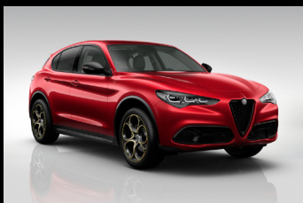
Červená Etna (5ZW-645) Pouze Intensa