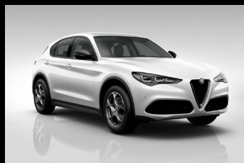
Bílá Alfa (2H6-240)